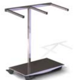
Verrijdbare postzakhouder voor twee postzakken.