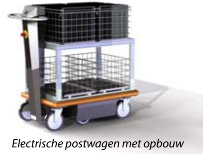
Electrische postwagen met opbouw

Naast een brede range aan standaard producten levert Ruys ook maatwerk. De inrichting van uw postkamer of werkplek wordt in 3d tekeningen uitgewerkt.