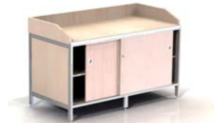
Werktafel met opstaande rand, schuifdeuren en legplank.